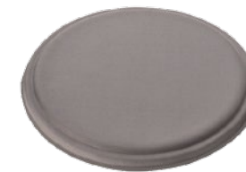
ムーンロック /Moon Rock