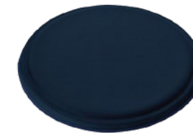
マリンブルー /Marine Blue