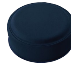
マリンブルー /Marine Blue