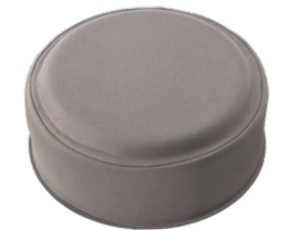
ムーンロック /Moon Rock