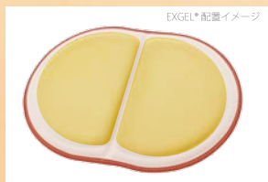
EXGEL® 配置イメージ 圧力のかかる坐骨部をエクスジェルが やわらかく支えます。