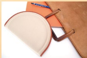
折りたたむと A5 サイズ 厚み 14mm