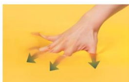
衝撃を吸収する弾力性

エクスジェル®は、車椅子での床ずれ対策を目的に加地が独自に開発した、驚異的な柔軟性と衝撃吸収性を持つジェル素材です。低反発でも高反発でもない体圧“流動”分散の実力で、座る時に起こる3つの問題を解決します。