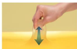
圧力を分散する柔軟性