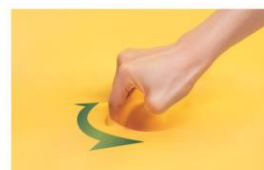
ズレに寄り添う流動性